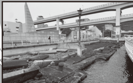
神戸港震災メモリアルパーク

「神戸港震災メモリアルパーク」では、阪神・淡路大震災で被災したメリケン波止場の岸壁を約60メートル、震災遺構としてそのまま保存しています。傍らには、神戸港の災害状況や復旧の過程を伝える模型や映像、写真なども展示。震災の壮絶さと、復興への努力が感じられます。