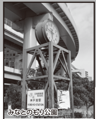
みなとのもり公園

「神戸港震災メモリアルパーク」では、阪神・淡路大震災で被災したメリケン波止場の岸壁を約60メートル、震災遺構としてそのまま保存しています。傍らには、神戸港の災害状況や復旧の過程を伝える模型や映像、写真なども展示。震災の壮絶さと、復興への努力が感じられます。