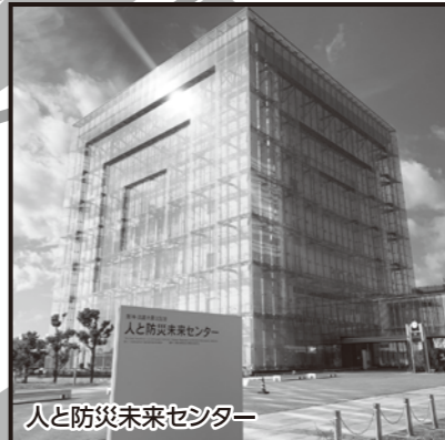
人と防災未来センター

1995年1月17日に発生した地震により6,400人を超える人命が失われ、甚大な被害をもたらした阪神・淡路大震災。その経験と教訓を継承し、防災・減災の実現のために必要な情報を発信する施設です。展示資料や当時の映像、震災体験の話などをと、一人ひとりが災害に対する正しい知識を身につけることができます。また、2021年にリニューアルした東館は、幅広い世代の皆さんに楽しみながら最新の防災知識を学び、自然災害に備える力を養っていただくことができます。(見学所要時間、西館と東館あわせて2時間)